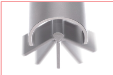
Schwenkbereich 120° Grad