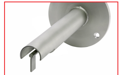
Robustes, integriertes Schutzdach