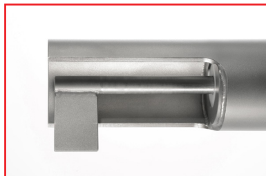
Flügel und Welle geschweißt